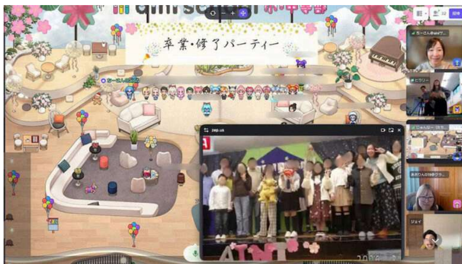
写真: 2026年3月にメタバースとリアル会場同時開催「卒業&修了式パーティー」

「オンラインを居場所にするはずっと家に引きこもってしまうのではと心配する方も多いと思うのですが、現実には逆のケースがほとんどなんです。一度リアルの学校から距離を置いた子が、aini schoolというオンラインの場で安心と自信を取り戻して、またリアルに戻っていくというケースのほうが圧倒的に多い。オンラインはリアルの敵じゃなくて、むしろリアルへの『入り口』であり『橋渡し役』なんです」