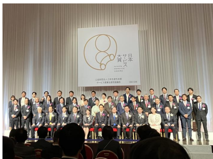
第5回日本サービス大賞 授賞式の様子