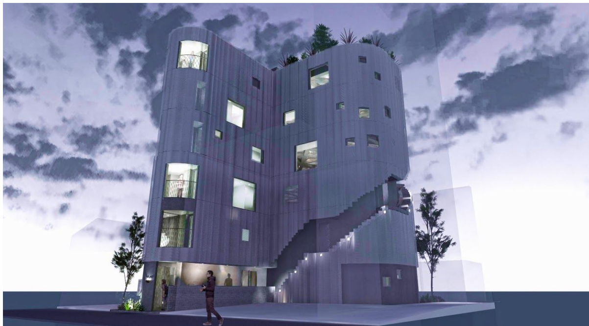
夕景パース（イメージ）

本建物は美観に配慮しながら専有面積のロスを極力抑えるために、建物外周にそって一筆書きのように続く階段を設置しており、建物をくり抜いたような特徴的なデザインとなっています。