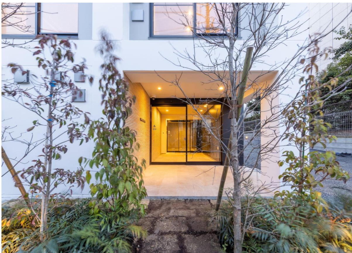
エントランスアプローチ

歩道と建物との間に植栽エリアを設け、パブリックとプライベートとの間に距離を取り、奥行きのある空間を演出している。地域に開かれた空間と暮らしのプライバシー性、両面を考慮した作りで幅広い層へ受け入れられる住まいを目指しています。