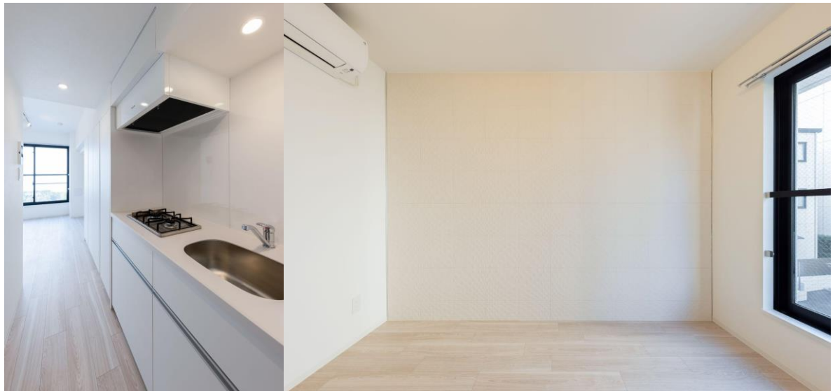
建物内（内装3パターン）

専有部内は、コンパクトな空間にキッチン、クローゼット、設備配管を壁側に集約させたシンプルかつ機能的で合理的なプランニングを行い、そこにニュートラルな色彩をそえる3つの内装パターンでデザインしています。1F・4Fはインダスト