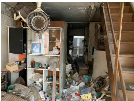
<建物の1階：残置物が散乱した状態>

「品川区空き家等対策計画」（平成31年3月）によると、品川区が「空き家である可能性が高い」と判定した建物は2017年度末時点で1,068戸、地区別にみると荏原地区（586戸）が最も多く、次いで大井地区（266戸）となっています。本物件は、この大井地区の南大井に位置する築年数不明の木造瓦葺2階建の空き家物件です。もとは、所有者様の親族が住居兼店舗として美容室を運営していましたが、廃業・相続に伴い、約20年間空き家として放置されていました。