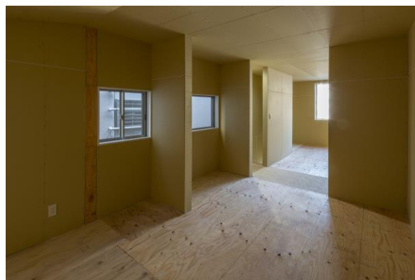
<建物の2階：元住居部分>