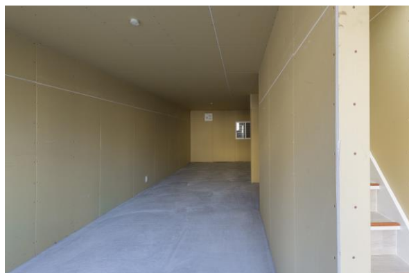
<建物の1階：元店舗部分>

今回の物件は外壁が剥がれ落ちていたため、外装の工事は特に念入りに計画しました。外壁の張替え工事、屋根の葺き替え工事などの工事に加え、1階床工事（土間打ち）、2階床下地工事、構造体補強工事、さらには利便性を向上させるための細やかな工事も当社負担で行い、本物件を再生させました。最後はボード張りまでを行い、本物件の利用者が自由に店舗の内装工事をできる状態にしました。