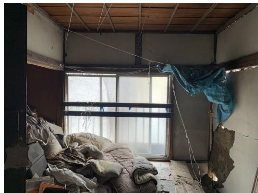
<建物の2階：壁が崩れ、外が見える状態>