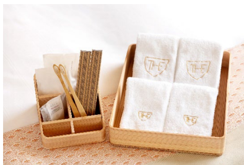
「博多曲物」のアメニティボックス