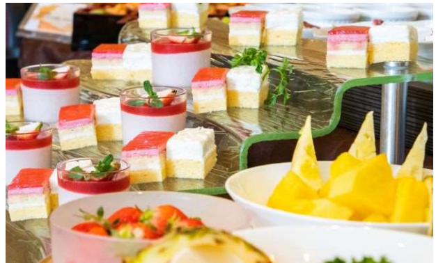
桜ランチbuffet イメージ