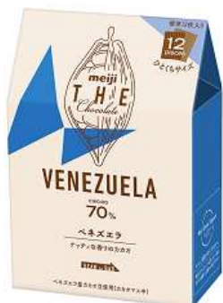
「明治 ザ・チョコレート ベネズエラカカオ70%」

※ 明治サステナブルカカオ豆とは農家支援を実施した地域で生産されたカカオ豆のことです。各産地の明治サステナブルカカオ豆は、カカオマスに使用しています。