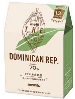
「明治 ザ・チョコレート ドミニカ共和国カカオ70%」