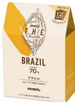
「明治 ザ・チョコレート ブラジルカカオ70%」