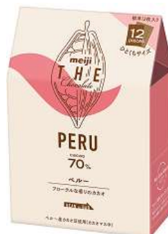
「明治 ザ・チョコレート ペルーカカオ70%」