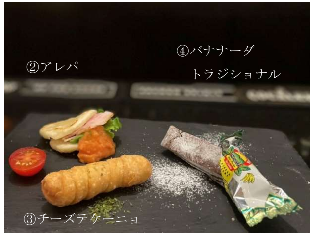
②アレパ ③チーズテターニョ ④バナナード トラジショナル