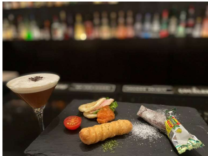
画像左) コラボルーム 画像右) 現地のスナックを取り揃えたプレートとオリジナルホットカクテル