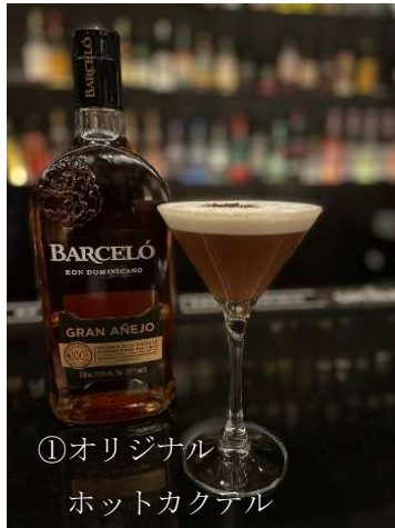
①オリジナル ホットカクテル