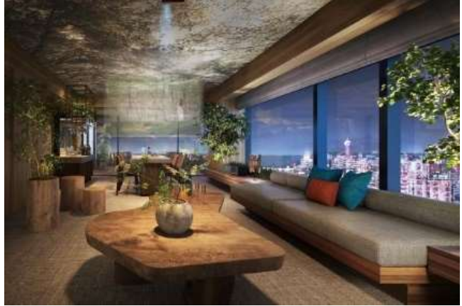
▲プロジェクターを完備した、バルコニスイート（キング）