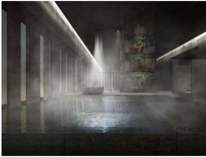
▲九州の渓谷をイメージした大浴場

九州の渓谷をイメージした大浴場は、天井から降り注ぐミストシャワーや揺れ動く光が幻想的で、サウナ（男性用：ドライサウナ、女性用：ミストサウナ）も完備しています。男性用のドライサウナは、黒