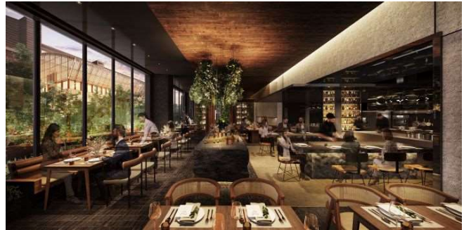
▲九州の食材を薪焼きで提供するレストラン

九州の山々で生育した天然木材、石やタイルなどの自然素材を基調とし、柔らかな雰囲気をつくるレストラン。豊かな風土に育まれた九州各地の食材を、九州の薪で調理して提供いたします。薪の薫りやパチパチと燃える音とともに、五感でお楽しみいただけます。