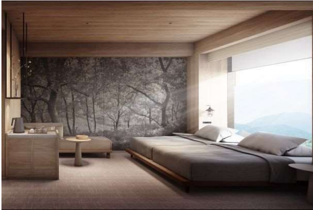
▲「自然」をテーマにした、スーパーアツイン リバーサイド