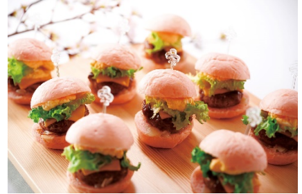
桜照り焼きチーズバーガー