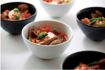
鯛のソテー あさり スペルト小麦の スープ仕立て