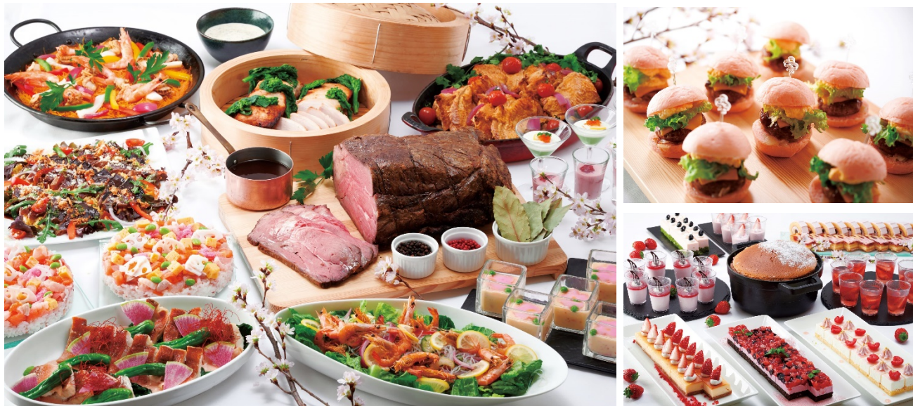
スカイブッフェー春のお祝い料理といちごと桜のスイーツフェア

春らしい鮮やかな色合いの料理が揃う本フェアでは、サーモンや枝豆で彩られた「桜ちらし寿司」や、ピンク色のバンズを使用した「桜照り焼きチーズバーガー」、いちごや桜を使った様々なスイーツをご用意いたしました。卒入学などお祝い行事が多い季節にぴったりの華やかな料理をお楽しみください。