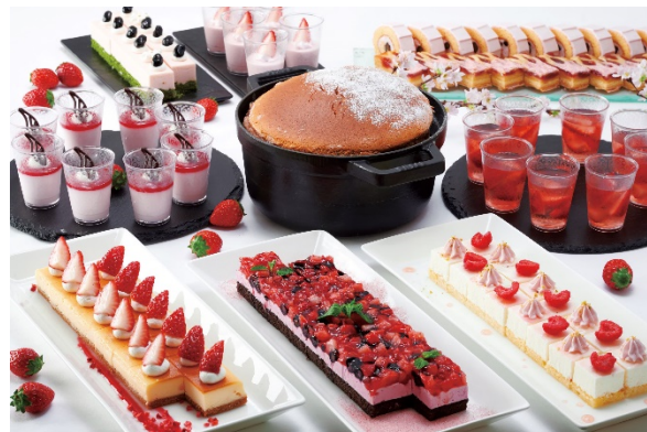
豊富なスイーツメニュー