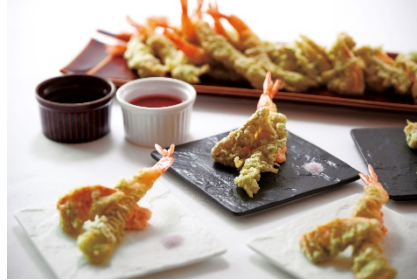
海老と筍の磯辺揚げ 桜塩とお好みの2種のソースにて