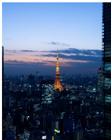
25F宴会場「しおさい」眺望例