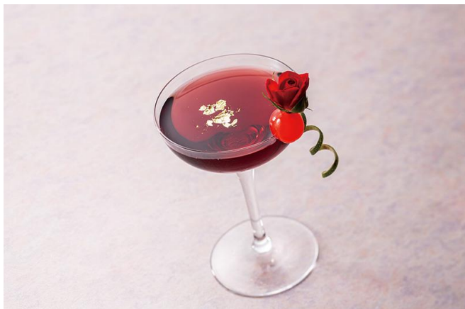
20周年記念カクテル