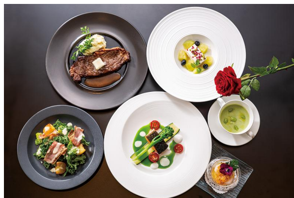
「20周年記念宿泊プラン」フルコースディナー