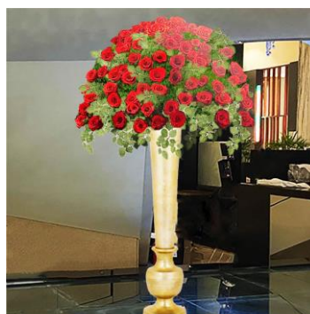
ホテル館内 20 周年記念装飾例

20 周年を記念するロゴには二重の線で「20」を描き重ね重ねの感謝の気持ちを、固く結んだ水引はお客様と培った 20 年の絆を象徴。また、20 年間支えてくださったお客様への感謝の気持ちを表現するテーマを社内募集し、「感謝を心に、最高のおもてなしを」を 20 周年記念のテーマとしました。9 月からは開業当時にホテル館内各所で飾られていた深紅のバラを回顧して、108 本の赤いバラを使用し、108「とわ（永久）」に続くお客様との絆を祈念した 20 周年記念装飾を実施します。