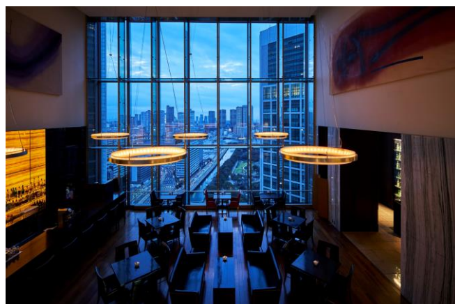
24F バー・ラウンジ「THE BAR」

※メニュー内容は食材の都合により変更となる場合がございますのでご了承ください。※画像は全てイメージです。