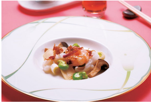
海老 烏賊 空豆 大黒しめじの XO 醤炒め