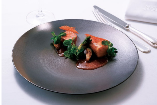
サーモンと生ハムのコンビネーション カシスマスタードソース