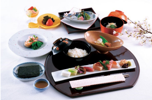
弥生のミニ会席“盛春の味覚と手巻き寿司”