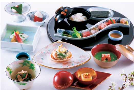
卯月のミニ会席“陽春の味覚と手巻き寿司”