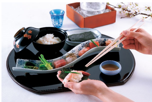
お食事の手巻き寿司