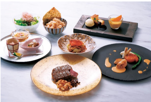
漣(さざなみ)“ふらの和牛サーロイン”

ふらの和牛をはじめ、鮭や帆立貝柱など北海道の恵みを存分にご堪能いただけます。目の前で調理される臨場感とともに楽しみください。