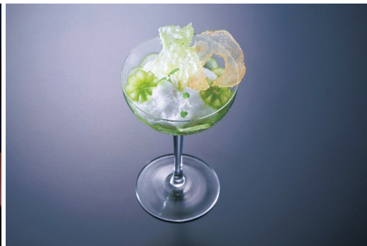
クロージング特別イベント“感謝の一皿” 洋梨とシャインマスカットのコンビネーション