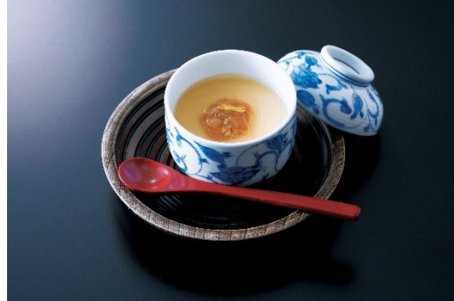
クロージング特別イベント“感謝の一皿” このわたの茶碗蒸し