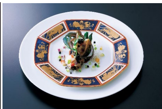
クロージング特別イベント“感謝の一皿” 花切り鮑の煎り焼き キャビア添え シャンパンと香味野菜のアンコールベッパー風味