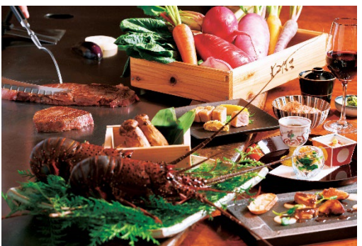
銘柄牛ディナー“葉山牛”

葉山牛と伊勢海老や松茸をご堪能いただけます。葉山牛はフィレとサーロインの両方をお召しあがりください。お食事には、湘南しらすと梅の焼き御飯をご用意いたしました。