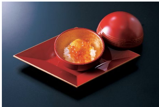
クロージング特別イベント“感謝の一皿” 雲丹といくらのおこわ