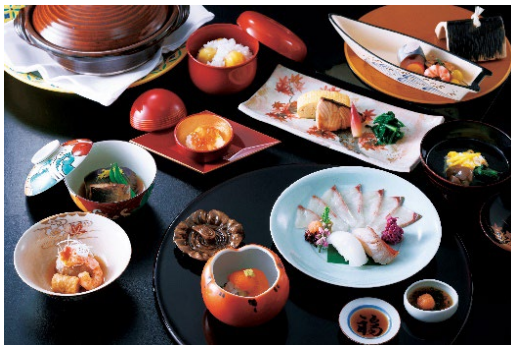
秋の美食会席 一色鮮やかな八寸と炙り金目鯛の握り