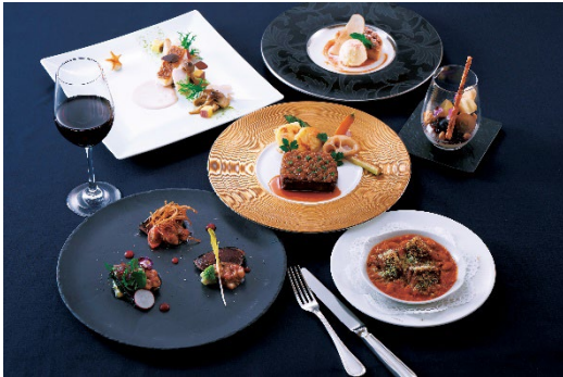
秋の星空ディナー

“星空の黒牛”サーロインのローストを、肉の柔らかさを生かしたシャリアピンスタイルでご用意。玉ねぎの甘みを生かしたソースが肉の旨みを引き立てます。北海道産国産牛の上質な脂の甘さと旨みを存分にお楽しみください。