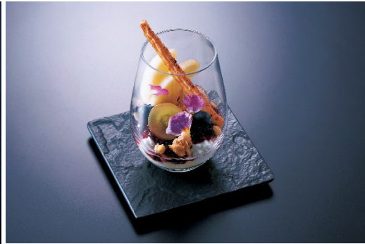
クロージング特別イベント“感謝の一皿” ぶどうと和梨のパルフェ