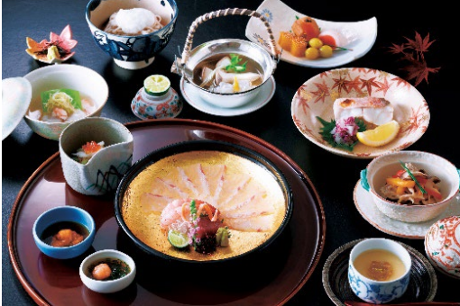
秋の美食会席 一鯛の薄造りと土瓶蒸し