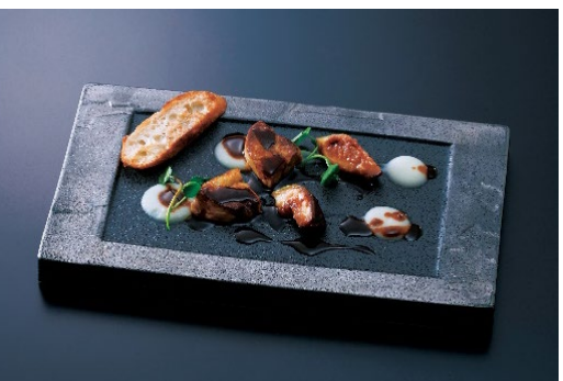
クロージング特別イベント“感謝の一皿” フオワグラのグリル 湘南ゴールドのソース