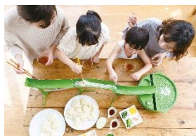
全長1mのビッグサイズ