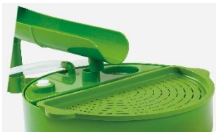
麺をのばさないザル付き