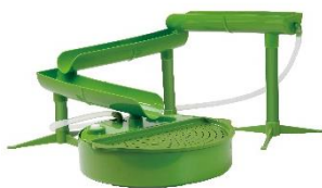
コンパクトなコの字型も