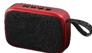
メタリックレッド