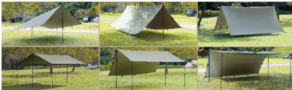
シーンに合わせているんな張り方が可能