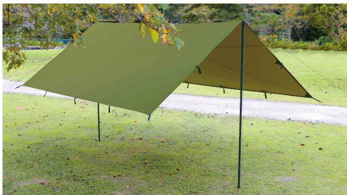
QUADRADO TARP 色：オリーブ ポール、ロープ、ペグは別売