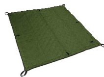
使いやすいオリーブグリーンカラー