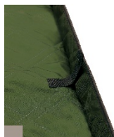
スナップボタンによるシート立ち上げ