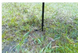
地面にも使えるペグスタンド