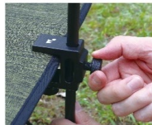
固定具で高さ調整