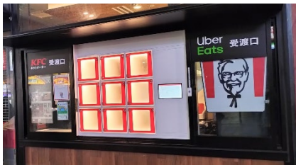
ケンタッキーフライドチキン様