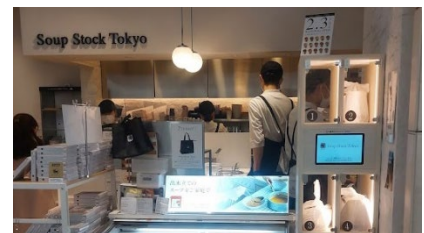
スープストックトーキョウ様

創業以来、無人レストランの実証実験を行うとともに、デリバリーやテイクアウト用の受け取りロッカーを開発・提供してきました。利用者、お客様、従業員、地域社会等、全てのステークホルダーを尊重しながら、IoTを通じた豊かな社会づくりを目指して事業活動を行なっています。