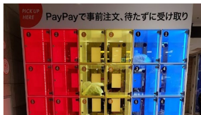
ジェイアール東日本都市開発様