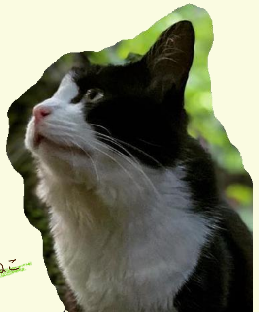
滑床溪谷の看板ねこ なめ