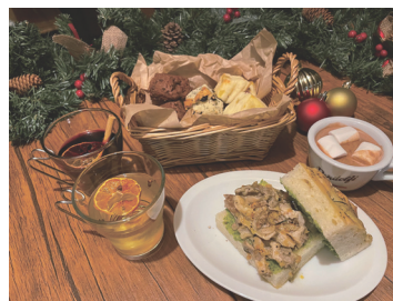
軽食やドリンクもご用意しています