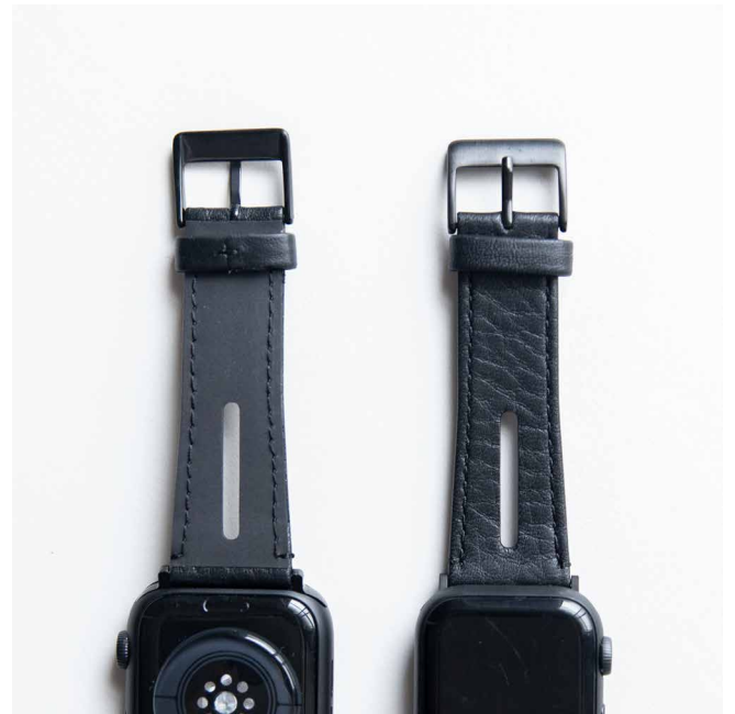
表面：防水シュリンクレザー、裏面：フッ素ゴム

Apple Watch バンドには、ブランドアイコンの浮き出し加工を模したスリットのデザインを取り入れました。スリットから手首の肌をのぞかせることで、軽やかな雰囲気演出します。バンド側面は、断面が露出しない革を折りたたむ「ヘリ返し仕様」を採用し、長く使用できるレザーバンドを目指しました。