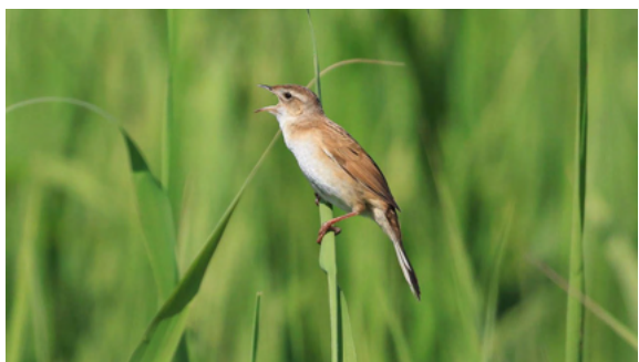
オオセッカ

認定を受けた事業計画の「地番の追加・削除」を行なうには、経済産業省への変更認定申請が必要です( https://www.enecho.meti.go.jp/category/saving_and_new/saiene/kaitori/dl/fit_2017/henkou_seirihyou.pdf )。現在、事業者と経産省間の計画地変更に向けての事前協議が整わず、本事業計画が中断している要因となっています。当会らは、計画認定後であっても自然環境への影響が懸念されることが明らかになった場合には計画地の変更を認めることで、再生可能エネルギーと生物多様性の維持を現状よりも両立させやすくなると考えています。