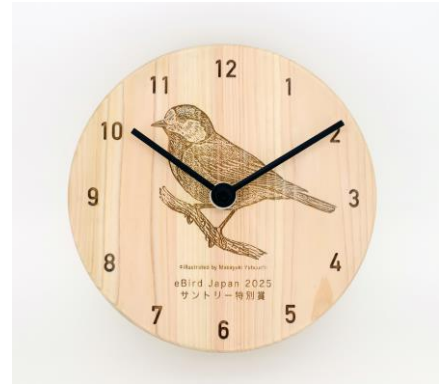
サントリーホールディングス（株）提供 「育林材の時計（ヤマガラ）」 直径約16cm イラスト：藪内正幸

https://www.suntory.co.jp/eco/forest/protect/ikurinzaei.html