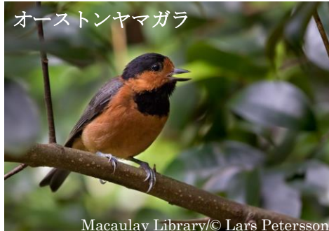
オーストンヤマガラ