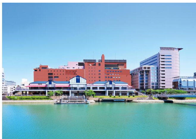
井筒屋 小倉店(北九州市 小倉北区)2020年11月24日(火)までPOP UP 開催