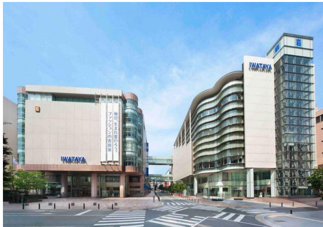
岩田屋本店(福岡市 中央区)2020年10月POP UP 終了後、 2021年2月吉日よりウイメンズモデルも常設展開開始。