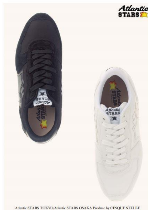
Authentic book of Atlantic STARS