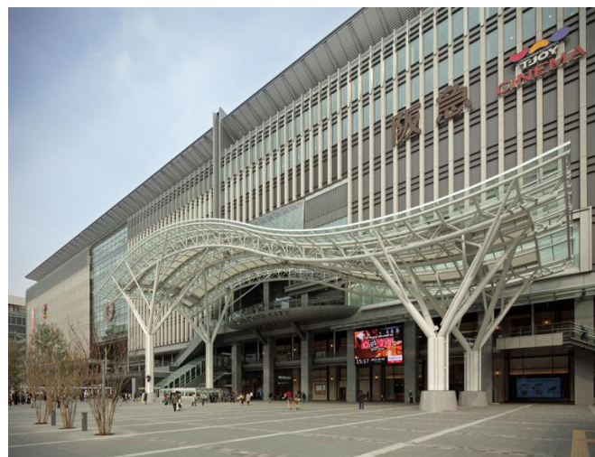
博多阪急(福岡市 博多区)2020年11月POP UP 開催