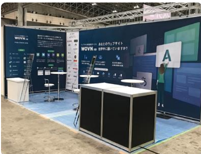
Wovn Technologies 株式会社 イベント総合展