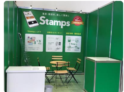
22 株式会社 店舗 IT ソリューション