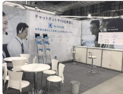
株式会社 Studio Ousia AI 人工知能 EXPO