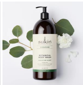
ボタニカル ボディウォッシュ