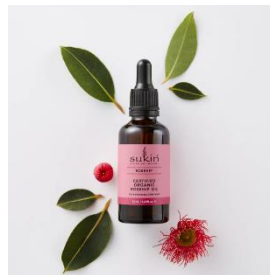
オーガニック ローズヒップオイル