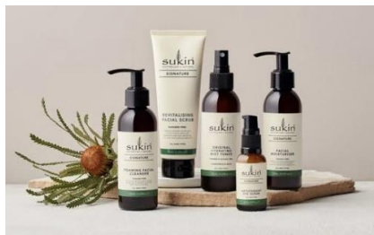
「Sukin」主要製品ライン (写真左から、泡洗顔、スクラブ洗顔、ミストナー、アイセラム、フェイシャル保湿剤)