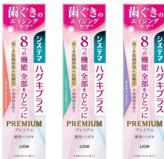
※年齢に応じた口腔ケア

※2 体内で糖とタンパク質が結びつき、AGEs（終末糖化物質）と呼ばれる悪玉物質が生成される反応。組織や細胞にダメージを与える一因として知られる