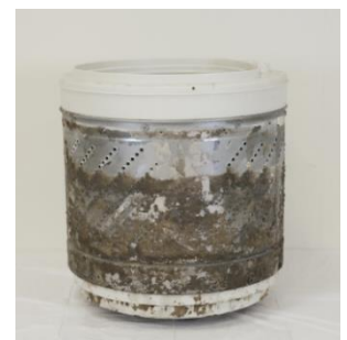
汚れている洗濯槽の裏

こうした悩みを解決するため、洗濯槽に入れるだけで、洗濯槽のカビ・ニオイ、衣類の生乾き臭の発生を防ぐ『NANOX 洗濯槽の防カビボール タテ型専用』を新発売いたします。本製品は、洗濯水を抗菌水に変えることによって「洗濯槽のカビ・ニオイを“落とす”のではなく発生を“防ぐ”という画期的な考え方で、生活者が最も嫌う洗濯槽の掃除にアプローチします。