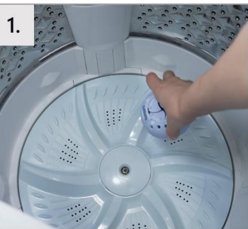
1. ボールを洗濯槽に入れる。