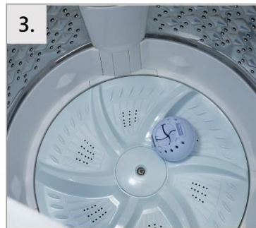
3. 洗濯後は入れっぱなしでOK!

* 洗濯槽の汚れ・臭いが気になる時は、使用前に洗濯槽クリーナーを使うとより効果的です。