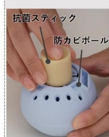
抗菌スティックを ボールに入れる。