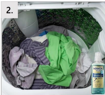
2. いつも通り、衣類・洗剤・柔軟剤を入れてお洗濯。