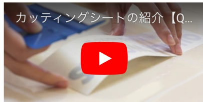
レスポンス・ウェブデザインにより、スマートフォンからでも快適にアクセス可能