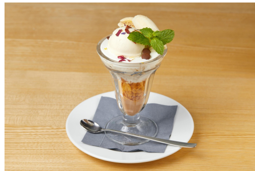
「もったいないバナナのパルフェ」 1,000円(税込)

陸上養殖の過程で環境に配慮した国産の幸エビは、頭から尻尾まで食べられる有頭エビ。揚げ油には、ワインを製造する際に廃棄される「ぶどうの搾りかす(残渣)」から作られたグレープシードオイルを一部使用しており、油っぽさを感じさせない軽さが特徴。幸エビをメインにしたシーフードフリットはエビの他、国内産の鯛やイカ、ズッキーニも使用。添えられたレモンも国産。