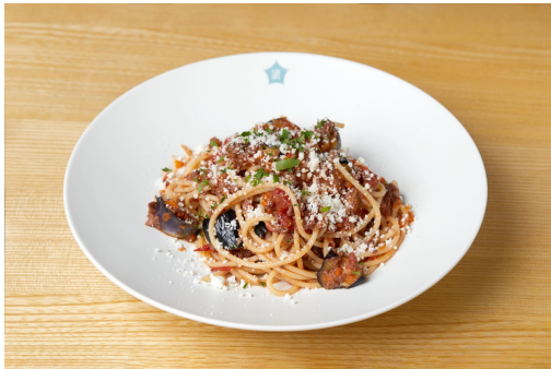
「焼きナスのソイボロネーゼ」 1,500円(税込)

ひき肉の代替として大豆ミートを使用したボロネーゼ。有機のブイヨンとオーガニックのホールトマトを使用し、パスタも有機栽培のデュラム小麦を100%使用したパスタ。トッピングされているチーズは植物性のソイチーズを使用。