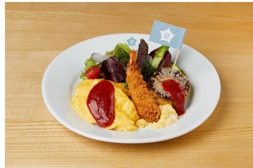
「この星のお子様ランチ」 950円(税込)

ひき肉の代替として大豆ミートを使用したボロネーゼ。有機のブイヨンとオーガニックのホールトマトを使用し、パスタも有機栽培のデュラム小麦を100%使用したパスタ。トッピングされているチーズは植物性のソイチーズを使用。