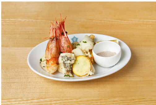
「海も幸せな海の幸フリット」 1,200円(税込)

オムライスには、平飼い鶏の卵と有機JAS認定のトマトケチャップを使用。サステナビリティに配慮したエビを使用したエビフライに一部有機野菜を添えた、大人も食べたくなるような贅沢なお子様ランチ。