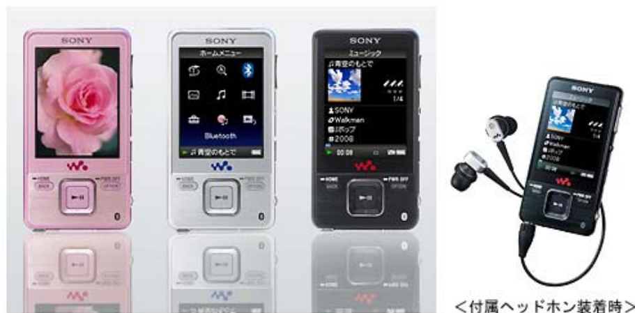
<付属ヘッドホン装着時>

近年、ヘッドホン、スピーカー、パソコン、車載機器など、Bluetooth(R)機能に対応した機器が増えています。本機では大画面でのビデオ再生、高音質での音楽再生に加え、Bluetooth(R)機能の内蔵により、音楽をワイヤレスで快適に楽しむことができます。外ではBluetooth(R)機能対応ヘッドホンでコードを気にすることなく音楽を楽しむ、家では“ウォークマン”をリモコンのように使ってBluetooth(R)機能対応スピーカーで再生する、さらにBluetooth(R)機能対応のカーステレオと組みあわせて“ウォークマン”の音楽を車内でも楽しむといった、ヘッドホンコードや接続ケーブルに制限されない自由なリスニングスタイルを提案します。