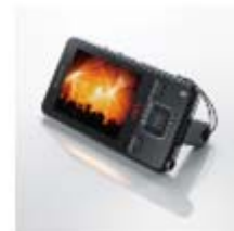
<スタンドチップ使用時>

付属のソフトウェア「Media Manager for WALKMAN」を使えば、インターネットで入手したビデオコンテンツを“ウォークマン”へ転送し、大画面液晶で楽しむことができます。高画質でのビデオ再生が可能なAVC(H.264/AVC)Baseline Profile形式と、様々なモバイル機器で広く普及しているMPEG-4形式に対応しています。また、見終わったビデオファイルは、パソコンを介すことなく“ウォークマン”本体で削除することも可能です。付属のスタンドチップを利用すれば、机の上などに置いて、横画面でビデオ再生を楽しむことができます。さらに、JPEG形式の静止画再生にも対応し、音楽を聴きながらスライドショーで写真を楽しむこともできます。