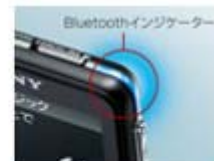
Bluetoothインジケータ ストリーミング中などの 動作状況をLEDで表示