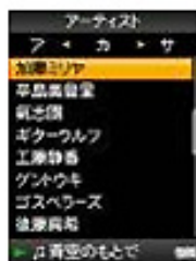
<50音順の読み仮名検索画面>