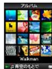
<「ジャケットサーチ」画面>