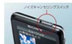
<ノイズキャンセリングスイッチ>

本体上部のスイッチを切り替えるだけの簡単な操作で、周囲の騒音を約1/4に低減します。通勤電車でのビデオや音楽視聴時にも、騒音を軽減しクリアな音質でお楽しみいただけます。また音量を上げ過ぎずに視聴できるため、音漏れの心配も減少します。