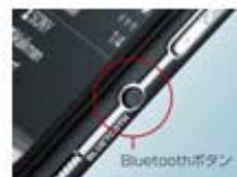
Bluetoothボタン 2秒以上押すことで接続/切断 操作をショートカット

本体右側面にBluetooth(R)ボタン、上面にインジケータを装備。Bluetooth(R)ボタンを長押しすれば、あらかじめ設定(ペアリング)してBluetooth(R)機器と簡単に接続できます。