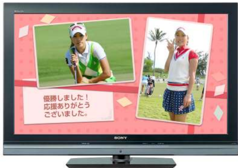
<ブラビア>に届くポストカードのイメージ図

ソニーマーケティング株式会社は、液晶テレビ<ブラビア>*1 をお持ちのお客様に「<ブラビア>ポストカード」サービス*2 をご体感いただけるキャンペーンを、5月13日（水）より実施いたします。