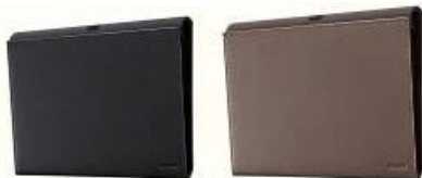
キャリングカバー 「SGPCV1」