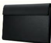
キャリングケース 「SGPCK1」