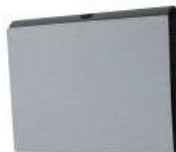
キャリングカバー 「SGPCV2」