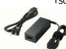
AC アダプター 「SGPAC10V1」