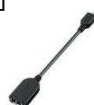
USB アダプター ケーブル 「SGPUC1」