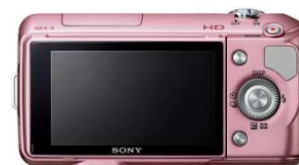
MOVIE (動画) ボタン

使いやすさを考慮した結果、ボタン数を最小限にし、項目選択や画面スクロールが容易なコントロールホイールを採用。携帯電話で広く使われているソフトキーの概念を取り入れ、場面ごとに用途が変わる2つのボタンで、さまざまな機能を直感的に操れます。さらに操作音にもこだわること、これまでの一眼カメラにはない、新しい操作感を手に入れました。