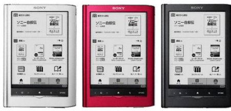
<シルバー> <レッド> <ブラック>