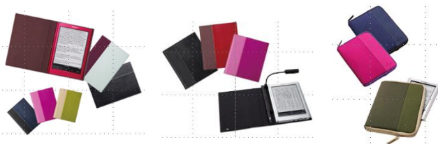
<ブックカバー> <ライト付ブックカバー> <ソフトキャリングケース>