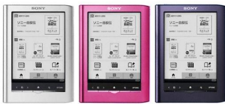
<シルバー> <ピンク> <ブルー>