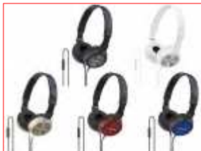
<Android対応> 商品名：DR-ZX302VP 希望小売価格：¥4,935 (税抜価格：¥4,700)