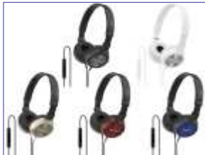
<iPhone対応> 商品名：MDR-ZX300IP 希望小売価格：¥4,935 (税抜価格：¥4,700)