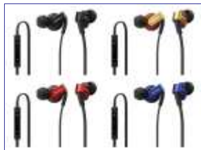
<iPhone対応> 商品名：MDR-XB41IP 希望小売価格：¥7,455 (税抜価格：¥7,100)

iPhone対応商品(5機種)：・MDR-XB41IP・MDR-XB21IP・MDR-EX60IP・MDR-ZX300IP・MDR-ZX700IP Android対応商品(2機種)：・DR-EX62VP・DR-ZX302VP