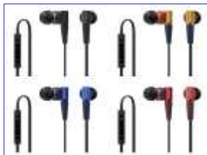
<iPhone対応> 商品名：MDR-XB21IP 希望小売価格：¥4,935 (税抜価格：¥4,700)