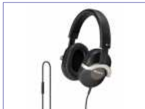
<iPhone対応> 商品名：MDR-ZX700IP 希望小売価格：¥13,125 (税抜価格：¥12,500)