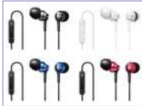
<iPhone対応> 商品名：MDR-EX60IP 希望小売価格：¥3,675 (税抜価格：¥3,500)