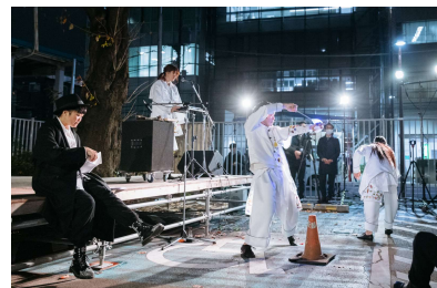
DamaDamTal によるパフォーマンス