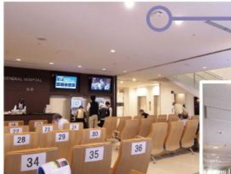
（左）ロビー風景、（右）病棟内廊下 （右上）天井に設置されたアクセス ポイント ACERA