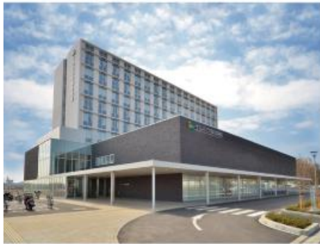
イムス三芳総合病院（埼玉県入間郡）

2013年3月の新病棟移転を期に、入院病棟含む9階建て全館の無線化に取り組まれる中、フルノシステムズの「無線LAN管理システム（UNIFAS）」に注目され、外部のデータセンターに設置する「クラウド型サービスによる無線LAN管理」のシステム導入を決定されました。