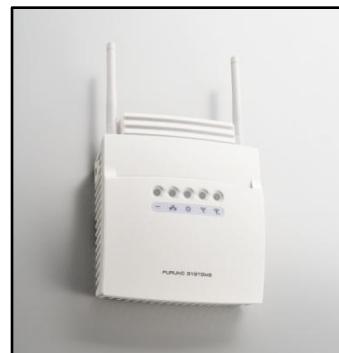
アクセスポイント「ACERA800」