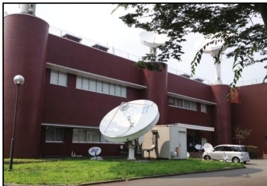
Leeデータセンター（外観：UNIFAS設置場所）

今年6月から提供を開始した『クラウド無線LAN』は、圧倒的なコストパフォーマンスと高品質な通信が評価され、多くの企業様から引き合いをいただいております。今回のようなデータセンターとの連携も増加していくものと予想しています。今後、無線LAN運用の形態もクラウド環境に移行されることで、今まで使えなかった場所でも、容易に無線LANを楽しめる環境が増えてくるものと期待しています。