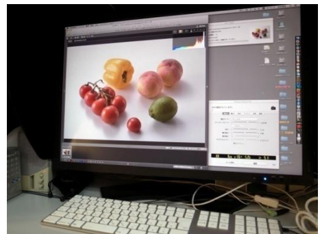
伝送された撮影画像データ