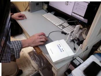
アクセスポイント