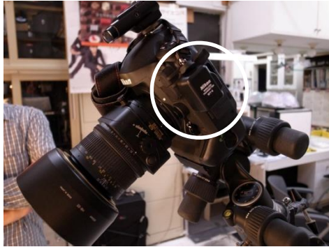
カメラに取り付けた 「ワイレストランスミッター」