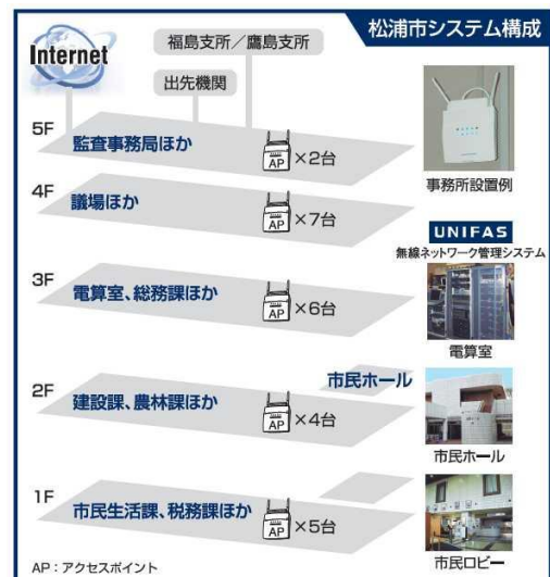
【無線LAN システム構成】