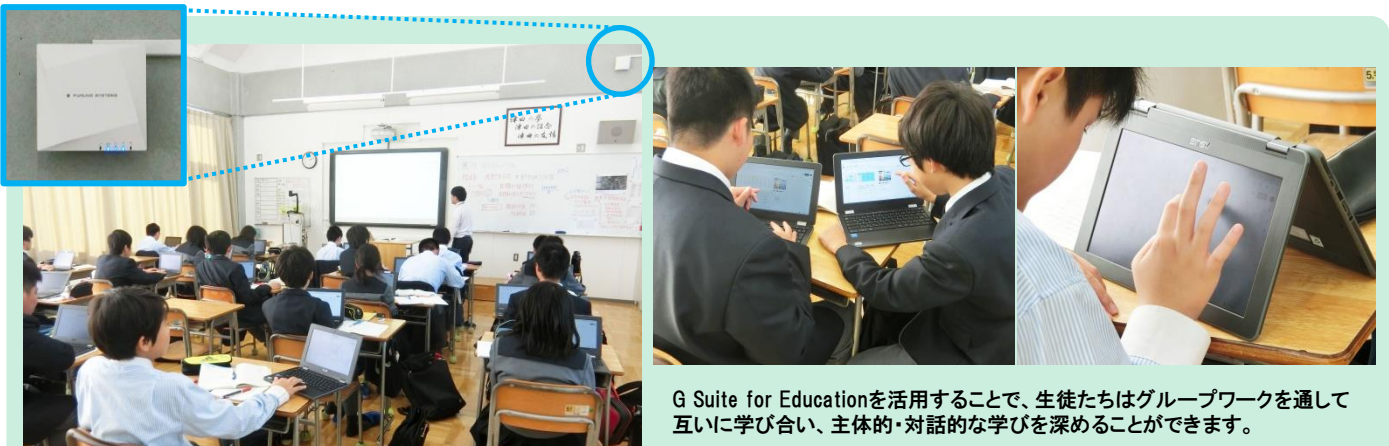
G Suite for Educationを活用することで、生徒たちはグループワークを通して互いに学び合い、主体的・対話的な学びを深めることができます。

ICT活用授業を円滑に実施するにあたり、ACERA導入以前に運用していたネットワークは、各教室において多台数の端末で高画質動画を再生するような接続が難しく、ネットワークの設計が求めるレベルに達していませんでした。無線ネットワーク環境の改善に向け、津田学園では新規の生徒専用無線LANを整備することになり、無線専門の国内メーカーとして30年以上の実績を持つフルノシステムズのアクセスポイントを採用しました。