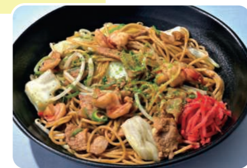
新感覚 屋台風焼きそば New sensation:Yatai-style Yakisoba

※表記の料金には税・サービス料が含まれております。※都合により、一部メニュー変更させていただく場合がございます。※写真はイメージです。