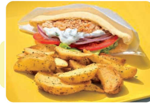
地中海風ピタサンド ヨーグルトソース Mediterranean-style Pita Sandwich with Yogurt Sauce