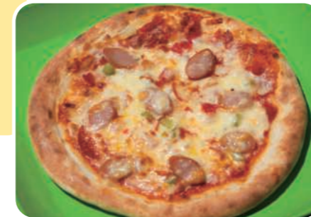
ナポリ風ミックスピッツァ Neapolitan-Style Mixed Pizza