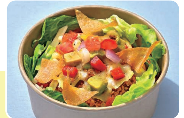
ころころ野菜のタコライス Taco Rice with Diced Vegetables