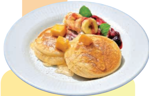
フルーツパンケーキ Fruit Pancakes