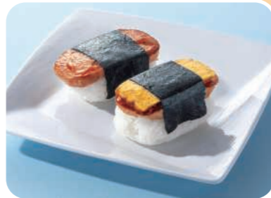
スパムおにぎり (プレーン・タマゴ&チーズ) Spam Onigiri (plain・egg and cheese)