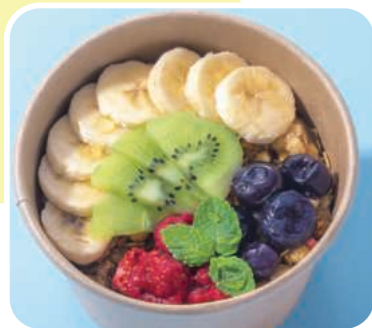
アサイーボウル ポートピアハニーがけ Acai Bowl with Portopia Honey