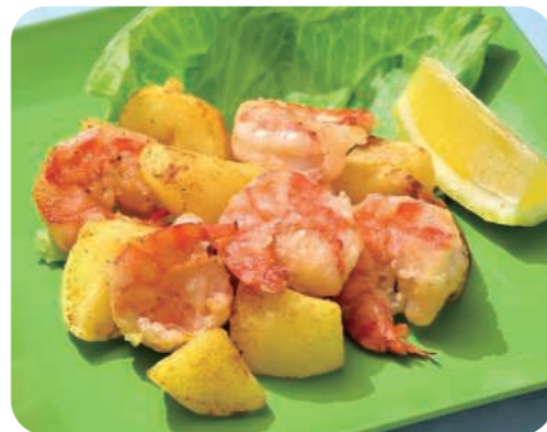
ガーリックシュリンプ Garlic Shrimp