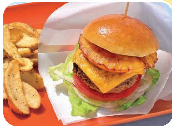
ハワイアンビーフバーガー Hawaiian Beef Burger