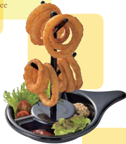
オニオンリングツリー Onion Ring Tree