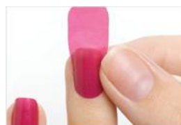
②爪の形に合わせて、直接貼ります。