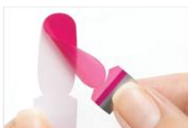
①台紙からはがします。