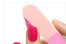
③余計な部分を切り取って、完成！