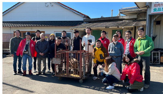
▲現地研修(スタディツアー/ワーケーション)