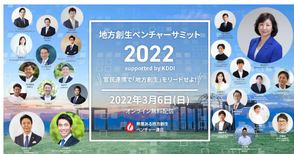
▲地方創生ベンチャーサミット2022