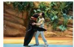
遠い昔から一緒だった 海からのやさしい贈り物に会おう