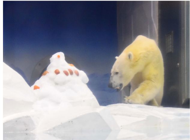
2019年7月23日「大暑の日」のプレゼントの様子↑

アドベンチャーワールド(和歌山県白浜町)では、暦の上で最も暑いとされる7月22日（水）「大暑の日」にちなみ、前日7月21日（火）にホッキョクグマへ「氷」をプレゼントします。展示場内のプールに大小さまざまなサイズの氷を浮かべます。氷が大好きなホッキョクグマはどのような反応を見せるのでしょうか。ホッキョクグマへの大暑の日特別プレゼントの様子は公式ホームページ・公式SNSにて公開いたします。