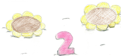
プレゼントイメージ