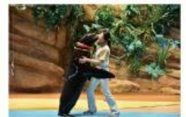
遠い昔から一緒だった 海からのやさしい贈り物に出会う