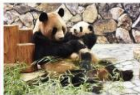
新たな出会いと感動の空間 パンダファミリーに感動の大接近